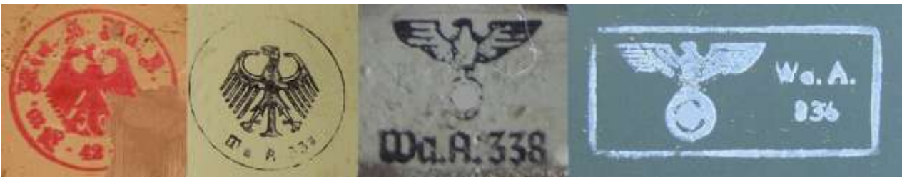
Heeres-Abnahmestempel der Reichswehr und Wehrmacht 1928, 1935 und ab 1936

Die Abnahme aller Lieferungen an Heer, Luftwaffe oder Kriegsmarine dokumentierte einerseits die Einhaltung der Technischen Lieferbedingungen und andererseits den Eigentumsübergang vom Hersteller an den Auftraggeber. Insofern ist der Abnahmestempel auch ein sichtbarer Eigentumsnachweis gewesen. Nur bei Röhren gab es unabhängig vom Abnahmestempel noch einen weiteren Stempel, der sie als Eigentum des Heeres, der Luftwaffe oder der Kriegsmarine kennzeichnete.