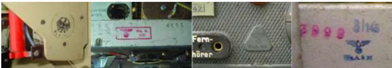
5 W.S. Wa.A.338

nahe beim Typschild, häufig auf dem oberen Rand der (Guss-) Frontplatte oder an den Seitenflächen des Chassis.