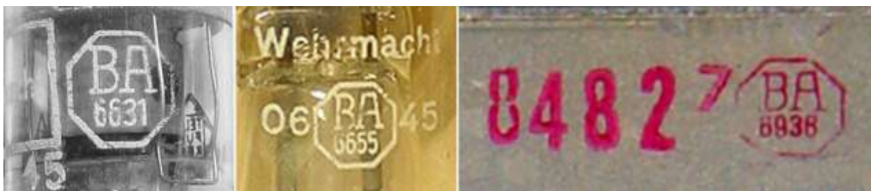
Betriebsabnahme-Stempel auf RV12P2000, LS180 und einer Baugruppe Torn.Fu.g

Aus Mangel an qualifiziertem Personal bei den Abnahmedienststellen ist gegen Kriegsende ein vereinfachtes Abnahmeverfahren eingeführt worden.